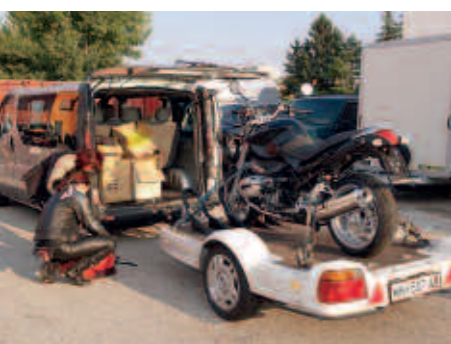
Gepäcktransport durch 3LOG.at