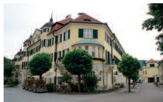
„Bio-Aktiv-Hotel“ Dungal in Gars am Kamp