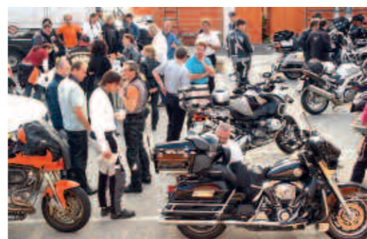
Treffpunkt bei Fischer's