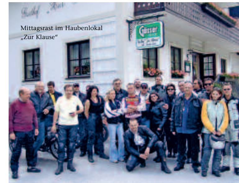
Mittagsrast im Haubenlokal „Zur Klause“