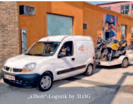
„a3bob“-Logistik by 3LOG